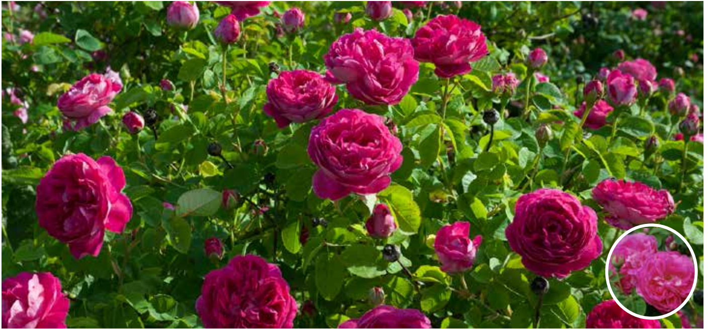
Rosa (Bourbon-Gruppen) 'Pipar Hans' Grönt kulturarv® bourbonros 'Pipar Hans'

En ros insamlad i Västmanland genom POM med tämligen tätt, buskigt växtsätt med upprätta bågböjda grenar. Blommor i slutet av juni-juli med varmt karminröda till ceriserosa fyllda blommor. Blommorna är grunt skålformade och exponerar därför delvis ståndare i mitten. Kronbladens undersidor är ljusare än ovasidan och mer silveraktigt ljusst rosa. Stark doft. Fräscht grönt bladverk. Trivs i sol-halvskugga. Blir vacker som solitär, i grupper och som buskage. Förhållandevis frisk sort.