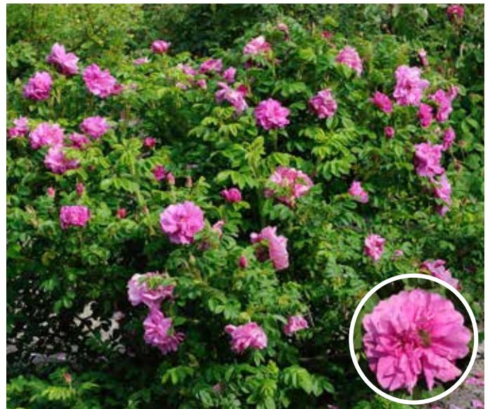
Rosa (Rugosa-Gruppen) 'Gryts Bruk' Grönt kulturarv® rugosa-ros 'Gryts Bruk'

En rugosa-ros insamlad i Närke genom POM. Tätt och brett växtsätt med styva grenar. Varmt, mörkt rosa blommor som skiftar mot svagt blåviolett med tiden. Fyllda blommor med medelstark-stark doft. Blomning från mitten av juni till början av juli. En andra, svagare blomning på eftersommaren. Gröna blad som är mindre än hos andra rugosa-rosor. Få plattrunda orangeröda nypon på hösten. Sol-halvskugga. Fungerar bra som friväxande häck eller solitär. Förhållandevis frisk från svampangrepp.