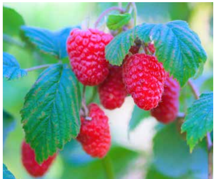
Rubus (Hallon-Gruppen) 'Stiora' hallon 'Stiora'