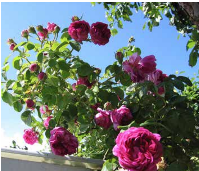
Rosa (Bourbon-Gruppen) 'Great Western' Grönt kulturarv® bourbonros 'Great Western'