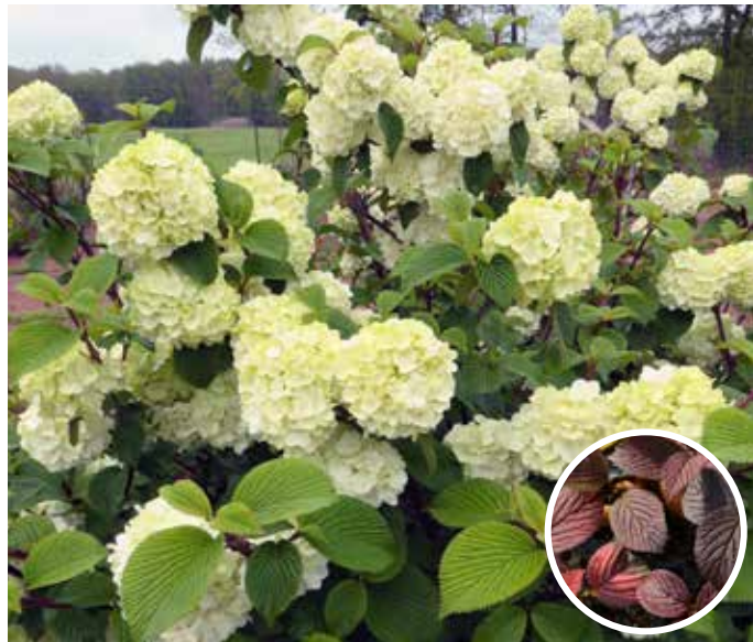
Viburnum plicatum OPENING DAY™ ('PIIVIB II' PBR-AF ) First Editions®-Serien japansk snöbollsbuske OPENING DAY™

Kompakt växande buske som på våren får bollrunda blommor. Blommorna är först grönvita och bleknar därefter till rent vita blommor. Mörkgröna blad med grov nervatur. Bladverket färgas mörkt rödlila på hösten. Trivs i sol till halvskugga. Passar fint som solitär både i hemträdgårdar som i parkmiljöer. Höjd och bredd 1,5-2 m. Zon 1-3.