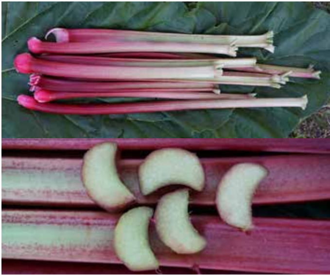
Rheum rhabarbarum BALSGLÄRD BERIT™ ('BRh F101') rabarber BALSGLÄRD BERIT™

En rikproducerande sort framtagen i svensk växtförädling. Upprätt växtsätt. Medellånga raka stjälkar i grönt med röd färg nertill. Stjälkarna har grön insida och är av medeltjocklek. God och stabil rabarbersmak, äppel- och oxalsyra något under medel. Mycket låg blomningsbenägenhet. Sol-halvskugga. Näringsrik och kraftig jord, gärna fuktig. Passar bra både i privatträdgården som i kommersiell odling. Motståndskraftig mot bladfläcksjuka.