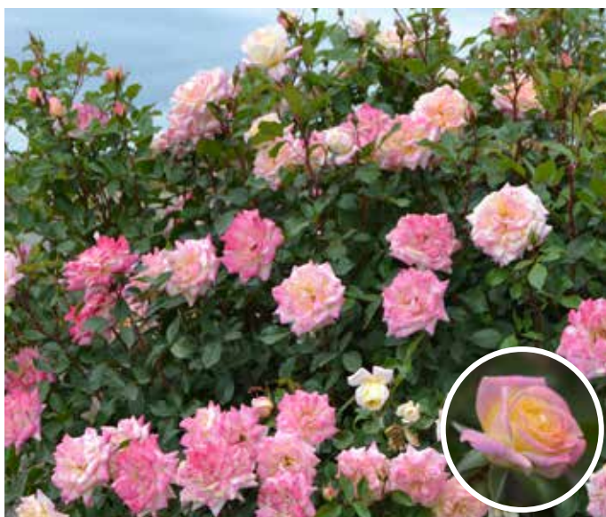
Rosa (Moderna Buskros-gruppen) Music Box ('Baibox') Easy Elegance®-Serien modern buskros Music Box

En vacker buskros med rundat växtsätt. Blommor kontinuerligt hela säsongen med fyllda, kräm gula blommor med rosa kant. Blommorna mörknar mot rosa. Remonterande och doftande. Grönt, glansigt bladverk. Trivs i sol och i näringsrik jord. Motståndskraftig mot sjukdomar. Rotäkta. Höjd 90-150 cm. Bredd 90-140 cm. Zon 1-4.