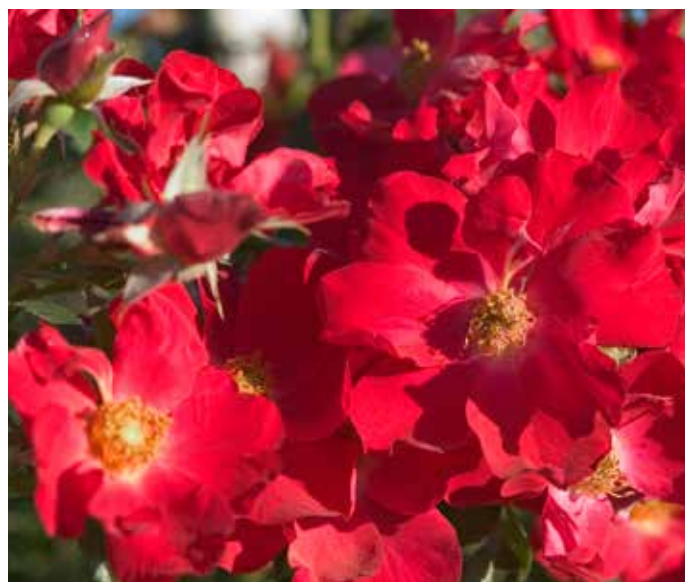
Rosa (Moderna Buskros-gruppen) SHOWTIME ('Baitime') Easy Elegance®-Serien modern buskros SHOWTIME