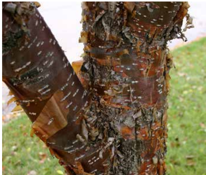
Syringa reticulata ssp. pekinensis China Snow® ('Morton') pekingsyren China Snow®