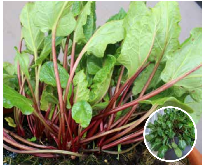
Rheum rhabarbarum 'Lilibarber' rabarber 'Lilibarber'

En småväxt rabarber för odling i kruka eller på balkong. Kan användas som traditionell rabarber, men även som bladgrönsak och kryddväxt då den ger en lite kryddig smak. Långa tunna röda stjälkar på ca 3-5 mm i diameter, som kan skördas hela säsongen från maj till september. Om man ej skördar får plantan ett lätt hängande växtsätt. I kruka bör den vintertäckas. Trivs i sol- halvskugga, helst i näringsrik, gärna fuktig jord. Höjd 20-30 cm. Zon 1-4.