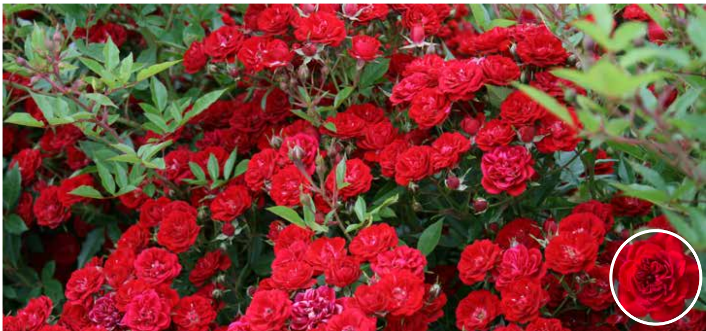
Rosa (Floribunda-Gruppen) CHI™ ('Baillim') Easy Elegance®-Serien floribundaros CHI™

En ny vacker ros i Easy Elegance-sortimentet! Upprätt kompaktväxande buskros med klarröda blommor i knippen. Remonterande. Mörkgrönt bladverk med röda bladkanter och -skaft. Sol-halvskugga, näringsrik jord. Utmärkt rabattros och även fin som solitär. Frisk sort. Rotäkta. Höjd och bredd ca 90-120 cm. Zon 1-3.