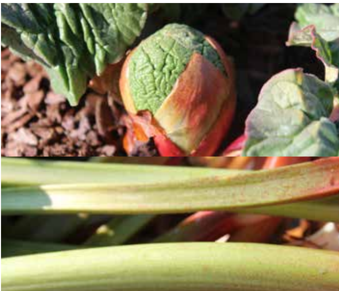
Rheum rhabarbarum 'Timperley Early' rabarber 'Timperley Early'

En tidig engelsk sort speciellt bra till drivning. Rosaröda stjälkar med gröna inslag. Rödare färg nertill mot basen. Långa, smala stjälkar med svag smak. Mycket rik avkastning. Sol-halvskugga. Näringsrik, gärna fuktig jord. Sorten lämpar sig mycket bra för framdrivning av så kallade glasrabarber.