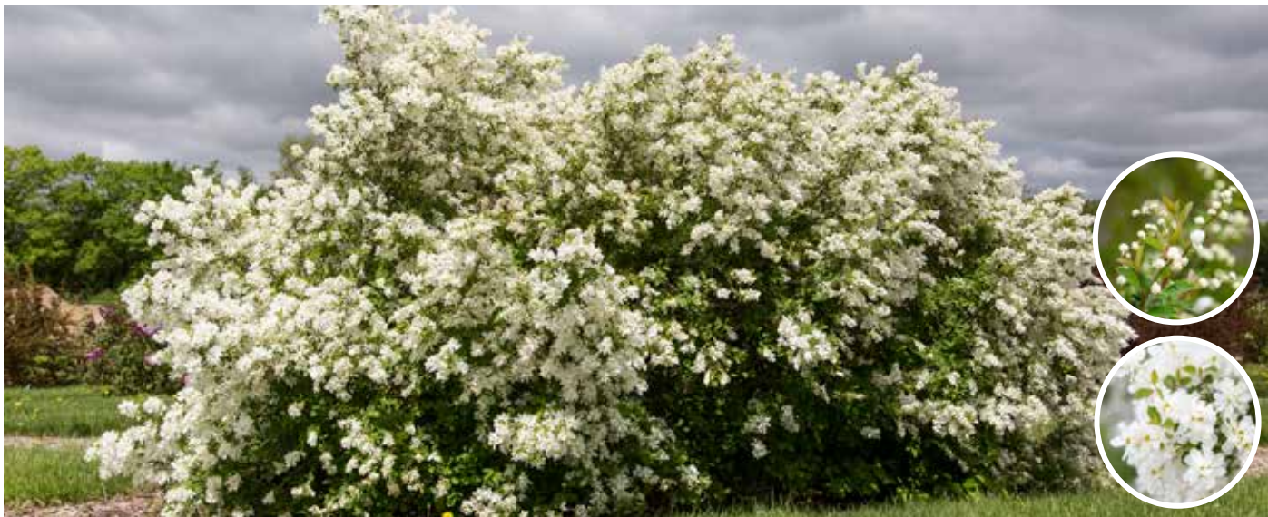
Exochorda x macrantha Lotus Moon™ ('Bailmoon') First Editions®-Serien pärlbuske Lotus Moon™