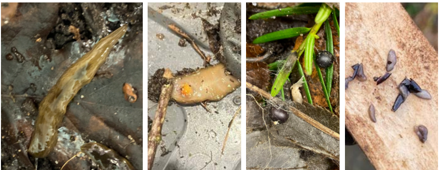
Bild 1. Vuxen mask. Bild 2. Maskens undersida med orange äggkapsel på väg ut. Bild 3. Äggkapslarna övergår till svart efter någon dag. Bild 4. Nykläckta maskar